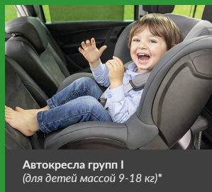
Автокресла групп I (для детей массой 9–18 кг)*