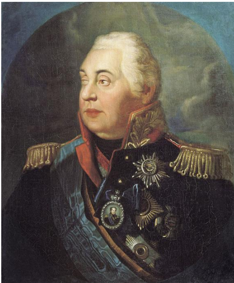
Михаил Илларионович КУТУЗОВ (1745 – 1813)

Прославленный русский полководец. Участник штурма Измаила (1790 год).