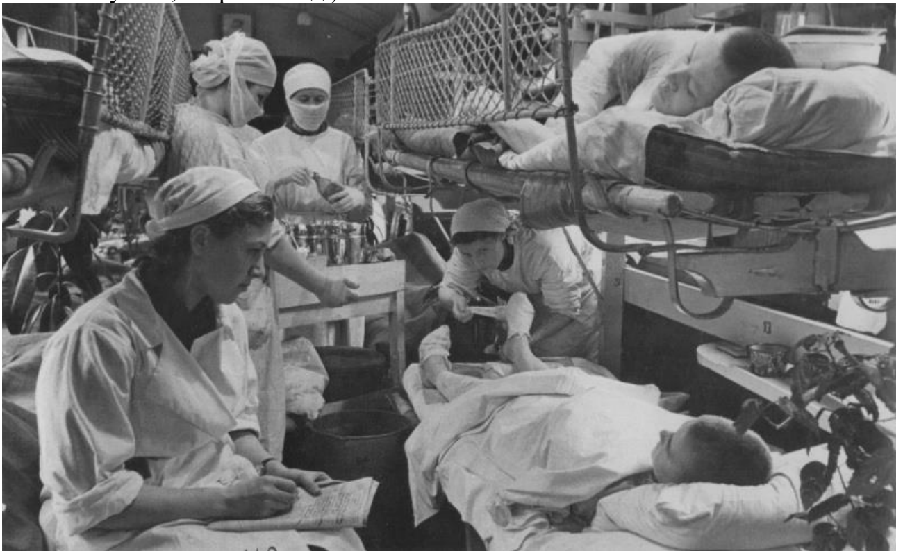
Военно-санитарный поезд № 72. Июнь 1944 г.

Победа далась народам Советского Союза невыносимо дорогой ценой. Погибли более 27 млн. советских людей. 6,8 млн. чел. были убиты на поле боя, погибли в результате ранений, аварий, несчастных случаев и т. д., 2,2 млн. чел. погибли во вражеском плену, 7,4 млн. человек мирного населения были уничтожены гитлеровцами на оккупированной территории, в лагерях смерти. 2,6 млн. человек погибли на принудительных работах в Германии, 1,5 млн. чел. погибли в зоне военных действий и в условиях блокады, демографические потери составили 6,7 млн. чел. (не родились, умерли в результате болезней, несчастных случаев, аварий и т. д.).